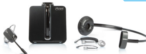
COMfortel DECT Headset