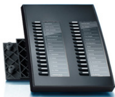
COMfortel Xtension 300