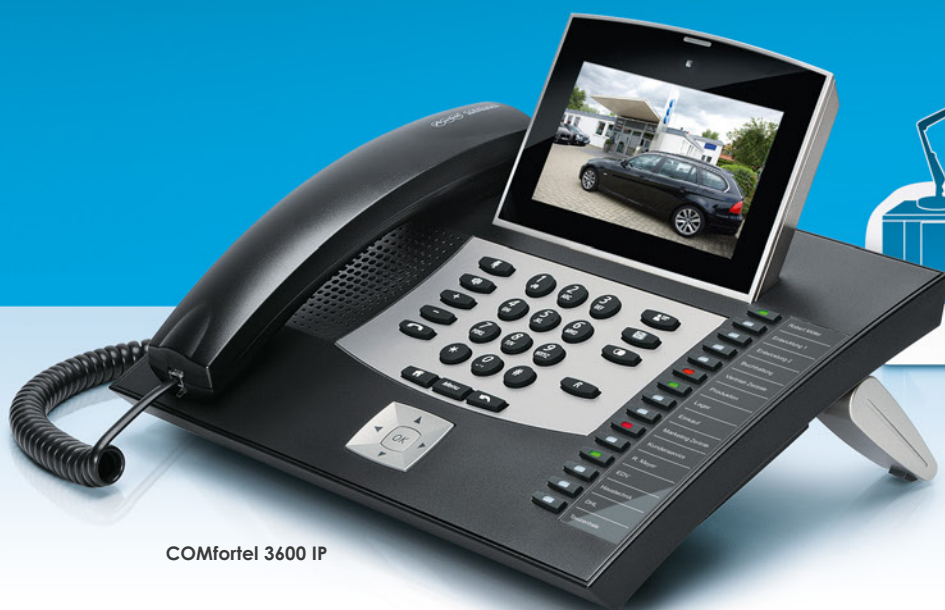
COMfortel 3600 IP

Ideal auch zur Steuerung der Gebäudetechnik!