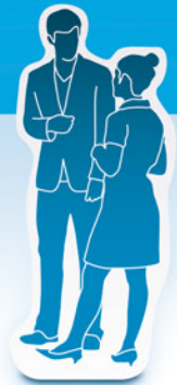
COMfortel 2600 IP